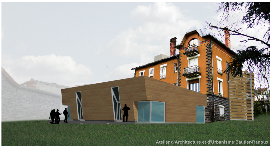
Atelier d'Architecture et d'Urbanisme Bautier-Ranoux

Il possède un solide cursus musical et des qualités humaines qui lui permettent de s'adapter rapidement à la fonction de chargé de direction.